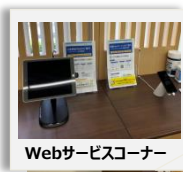
Webサービスコーナー