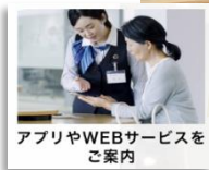
アプリやWEBサービスをご案内