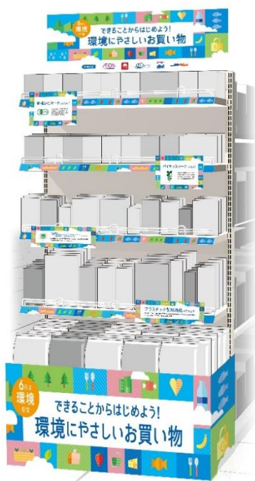
分科会①サステナブル共同販促 実施イメージ

賛同する流通企業5社の店舗（約310店舗）にて、2023年6月の環境月間に合わせた『サステナブル共同販促』を実施します。各社で選定したサステナブル商品を、共通の販促ツールを用いて展開し、お客さまに対してサステナブル商品とその背景や社会的役割を訴求します。商品選定基準として認証ラベル6種等を採用し、環境保全に寄与する認証ラベルの認知～消費拡大にも努めます。