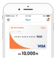
バーチャルカード (オンライン専用)