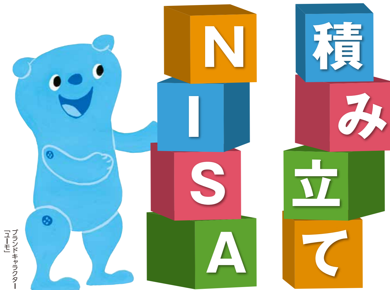
ブランドキャラクター