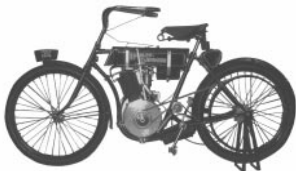
【1903 ~ 1904 初代HD】

このHDを、近年、福岡の街角で頻繁に見かけるようになりました。1450ccクラスで200万円は優にしますから、今日でも購入するのに“一大決心”がいる、という点は変わらないにせよ、“天下のハーレー”と雖も、かつてほど資産家の専有物ではなくなりつつあるかのようです。