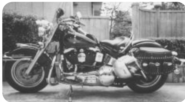
【ドレスアップした'94 FLSTC 福岡市在住Y氏所有】