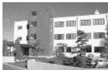
(株)西日本流体技研

JR佐世保駅からさらに単線の松浦鉄道でおよそ30分、北松浦郡小佐々町に株式会社西日本流体技研を中核とする流体技研グループがあります。船舶など流体力学関係の技術開発で、内外での評価が非常に高く、この分野を専門とする技術者、研究者が必ず一度は訪れることで知られています。